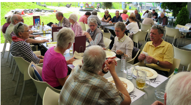
Im Rosengarten

Auf der offenen Terrasse des Café Münz in Küsnacht konnten wir Startkaffee/Gipfeli geniessen, so schön und warm war es bereits morgens um halb neun. Danach zogen wir 15 Wanderer los, vorerst noch drei Minuten im Stadtverkehr, dann bergauf in Natur pur des Küsnachtertobel. Auf halber Höhe des Tobels bogen wir links ab und machten nach knapp 1 Std. beim Schübelweiher eine erste Pause. Der Schübelweiher geriet vor einigen Jahren in die Schlagzeilen, weil dort illegal der Rote Sumpfkrebs ausgesetzt wurde. Dieser