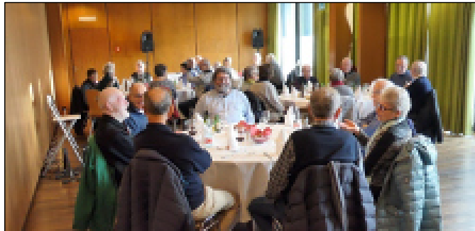
Diskussion am runden Tisch

Schmunzeln mit der Interpretation von bekannten und weniger bekannten Chansons von Mani Matter. Als letztes Lied interpretierte er dann das Chanson, das in keinem Repertoire fehlen darf, nämlich "s' Zündhölzli". Zu unserer aller Überraschung sang er danach eine von ihm gedichtete, aktualisierte Version mit 'Corona' als Thema: wir waren verblüfft, es klang als hätte Mani Matter es geschrieben. Zum Abschluss dieses Nachmittages liessen wir uns feinen Streuselkuchen mit Rahm und dazu einen Kafi schmecken.