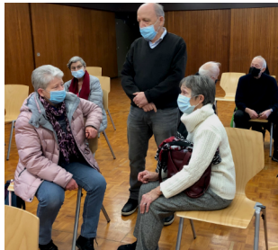
Zuhörende mit Corona Abstand

weil sie mehr Feuchtigkeit bekommen oder die prächtige Pyrenäen-Lilie, die nur dort vorkommt. Eine Landschaft mit See und Bergen ist unserem Walensee mit den Churfürsten sehr ähnlich. Der See ist allerdings ein Stausee, der dort nicht der Energiegewinnung dient wie bei uns, sondern als Wasserspeicher. Mit offenen Kanälen, die hunderte von Kilometern lang sind, wird das Wasser bis zu den tiefer liegenden Orangen- und anderen Plantagen geführt. Dies ist aber nicht sehr effizient, denn es gehen 30%-60% des Wassers durch